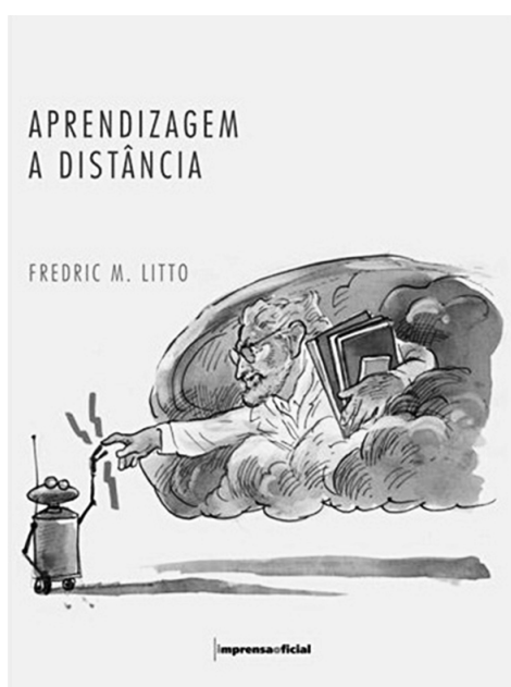
Figura 3: Capa do livro Aprendizagem a Distância , de Fredric M. Litto (São Paulo: Imprensa Oficial)