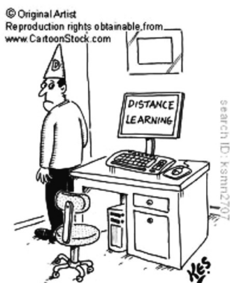
Figura 2: Charge sobre “educação a distância”

Na Figura 01, um efeito de sentido possível é o de que a EAD, na verdade, não representa nenhuma novidade na estrutura educacional, ou seja, a charge nega a ideia da EAD como “novo paradigma da educação”, uma vez que a sala de aula continua tendo o mesmo “formato” tradicional. O professor está representado pela tela de um monitor sobre a mesa na frente da classe e os alunos aparecem como pequenos celulares todos absolutamente iguais sobre as carteiras dispostas no layout clássico das escolas presenciais. O tamanho maior do professor em relação ao tamanho dos alunos parece sugerir que estes continuam ocupando a posição inferior de “expectadores passivos”, “receptores” do conhecimento, enquanto aquele continua na posição superior de detentor do conhecimento – posições já bastante criticadas até mesmo no ensino presencial, o que confirmaria a hipótese de ver na imagem a crítica sobre a EAD continuar seguindo o mesmo paradigma tradicional “ultrapassado”.