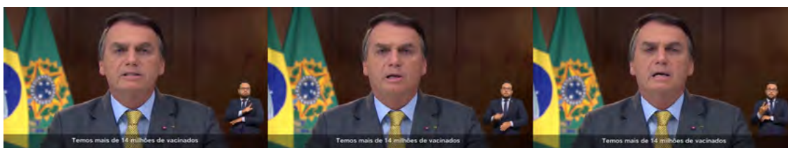
Figura 8. Apagamento da cloroquina

Fonte: Bolsonaro (2021, 00:00:49 – 00:00:51). Elaboração própria