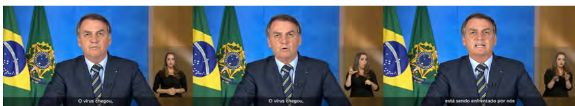
Figura 9. Certeza sobre o fim da pandemia