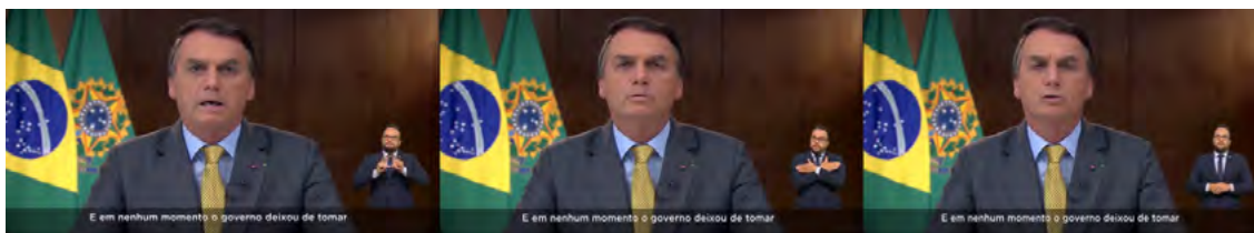
Figura 6. Negação da ordem para abandonar medidas protetivas de saúde pública