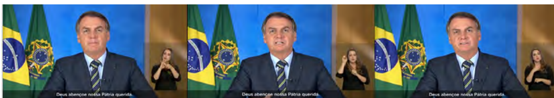
Figura 11. Manifestação de ideologia cristã