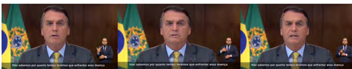
Figura 10. Incerteza sobre o fim da pandemia