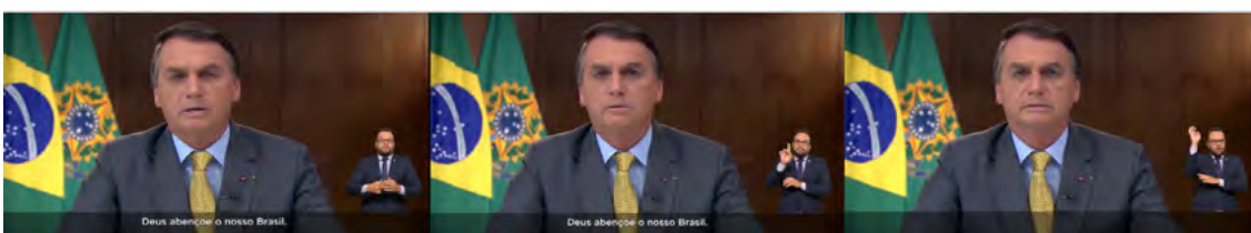
Figura 12. Confirmação de ideologia cristã