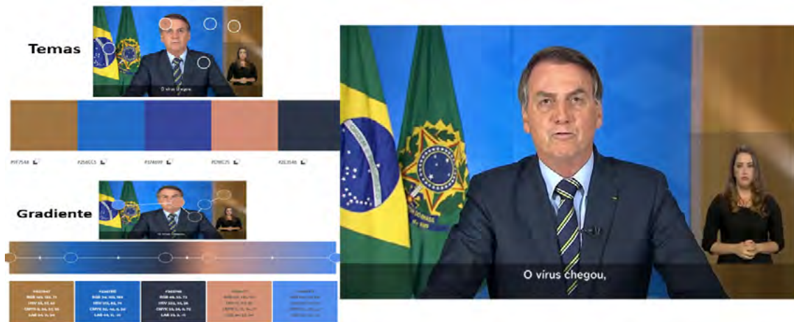
Figura 1. Escala cromática do pronunciamento 1, de 24/03/2020

Fonte: Bolsonaro (2020, 00:02:04) 5 . Elaboração própria