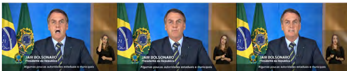
Figura 5. Ordem para abandonar medidas protetivas de saúde pública