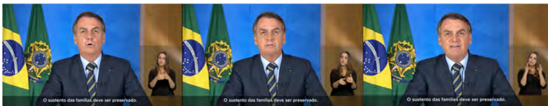
Figura 3. Composição arquitetônica do pronunciamento de 23/03/2020