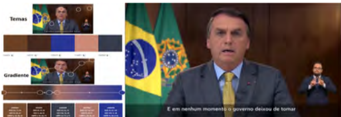
Figura 2: Escala cromática do pronunciamento 2, de 23/03/2021