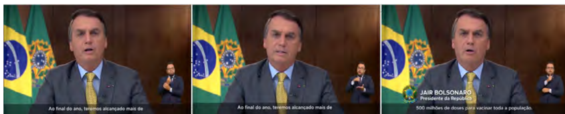
Figura 4. Composição arquitetônica do pronunciamento de 23/03/2021