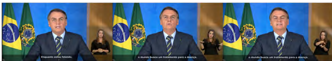
Figura 7. Defesa da cloroquina