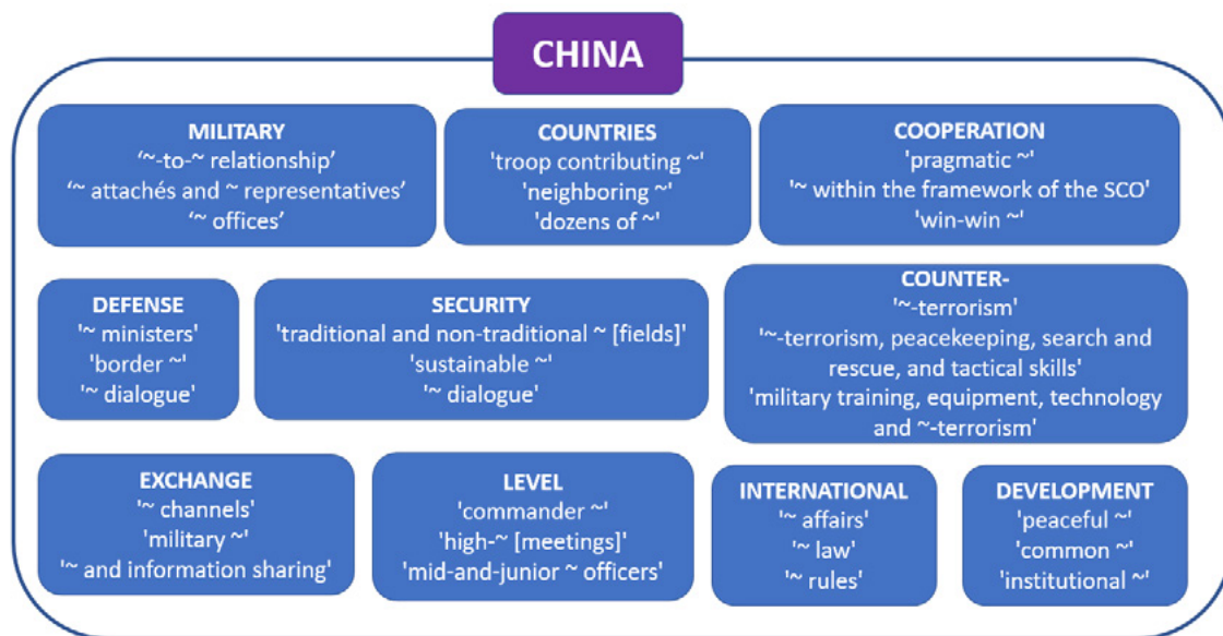
Figura 2. Perfil semântico lexical das combinatórias do Livro de Defesa da China