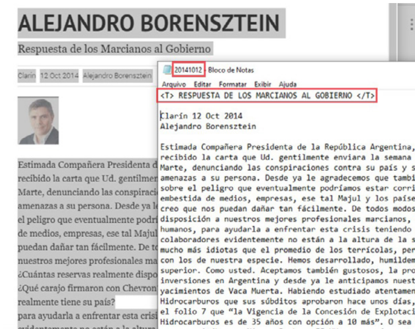
Figura 1. Compilação e preparação do corpus

textos. Por meio do acesso à página do colunista, foi necessário abrir as publicações disponíveis, selecionar o texto e copiar o conteúdo integral, em arquivos de texto plano, formato TXT. A Figura 1 ilustra o procedimento de compilação e preparação dos arquivos.