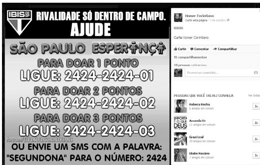
Figura 3. Postagem “Meme Criança Esperança”, publicado na fanpage Homer Corintiano

No terceiro exercício de leitura, o último texto escolhido para a sexta atividade foi a postagem que se observa na figura 3: