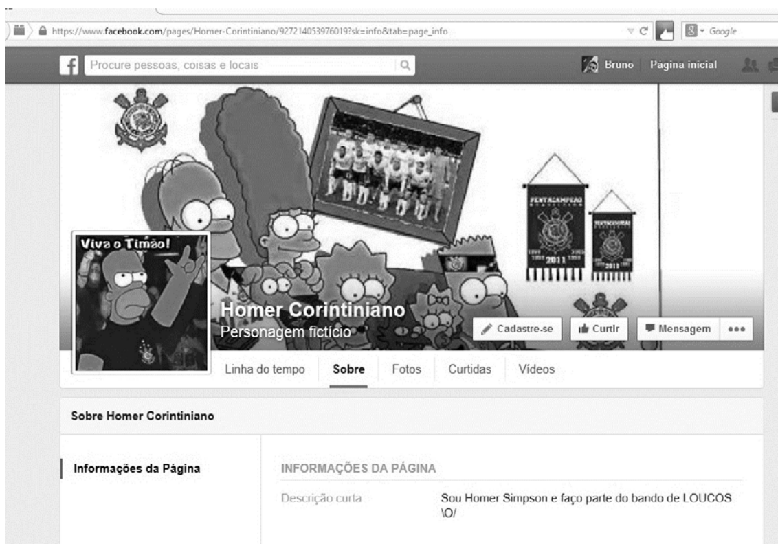
Figura 1. Capa da fanpage

No primeiro exercício de leitura, o texto escolhido para a atividade foi a capa da página Homer Corinthiano, conforme se visualiza na figura 1: