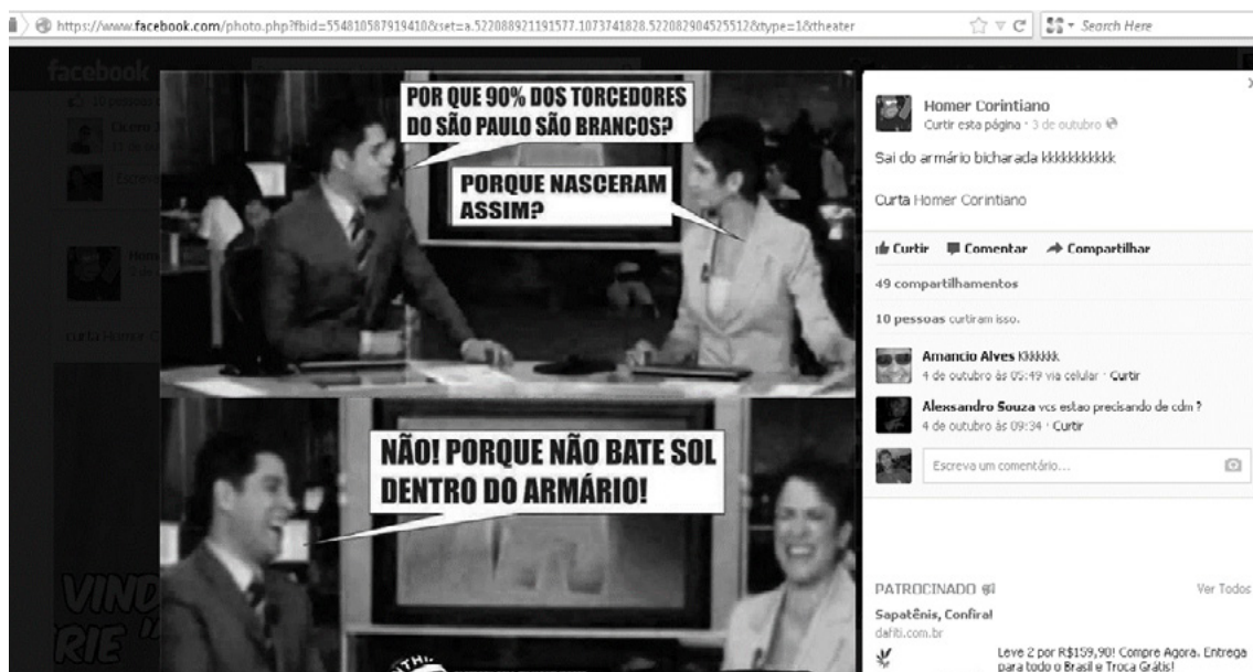
Figura 2. Postagem “Meme Jornal Hoje”, publicado na fanpage Homer Corintiano

Por sua vez, nesta sexta atividade, no segundo exercício de leitura, o texto escolhido para os exercícios foi esta postagem, conforme se observa na figura 2: